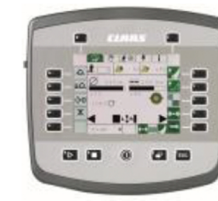
コミュニケーター II